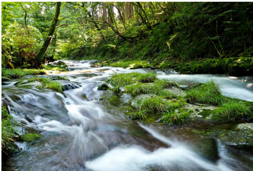
撮影地:静岡県伊豆市