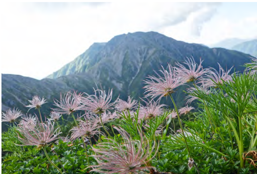
撮影地:静岡県静岡市 / 撮影者:加藤 健一