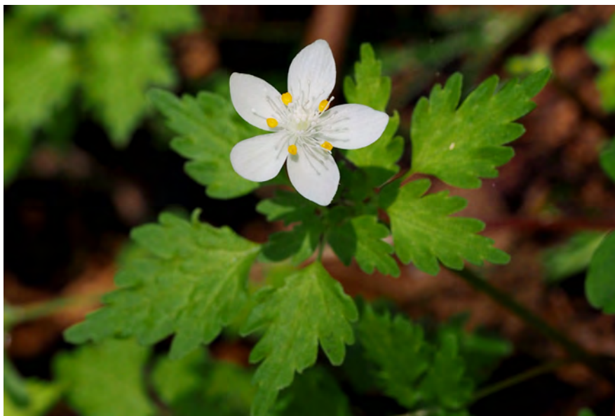
撮影地:静岡県富士宮市