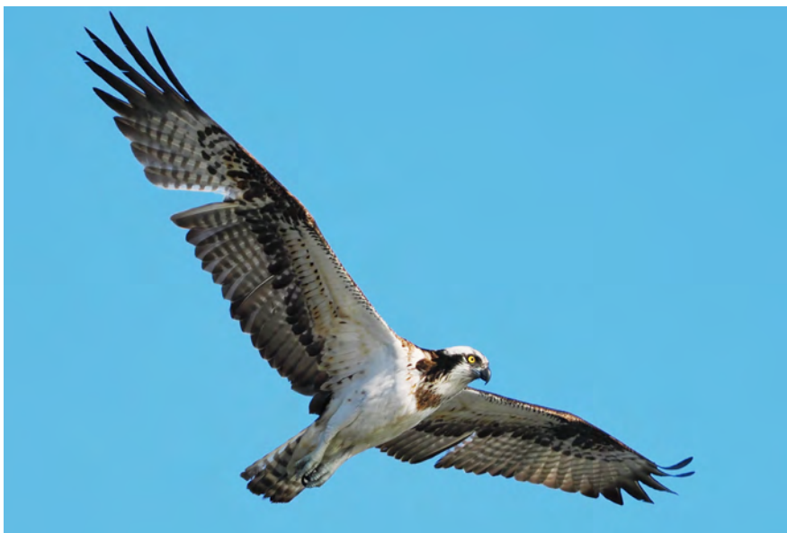
撮影地:静岡県静岡市

【 分 布 】…………… 本州・四国・九州・琉球諸島では留鳥ですが、北日本では夏鳥です。