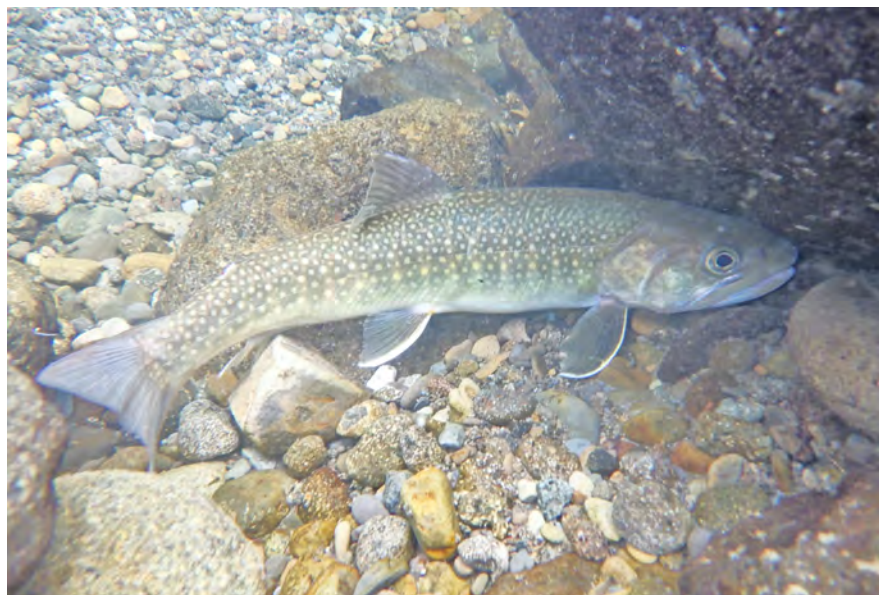
撮影地:長野県北安曇郡小谷村

【 分 布 】…………… ロシア東部から日本にかけての沿岸、河川域に自然分布しています。また、北海道・本州・四国・九州各地の河川や湖沼に放流されています。