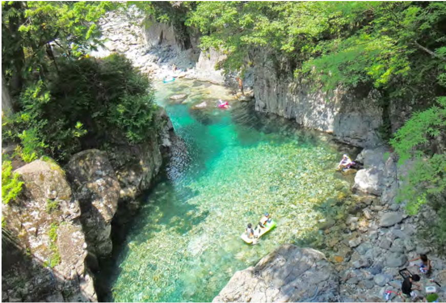
撮影地:長野県木曾郡大桑村