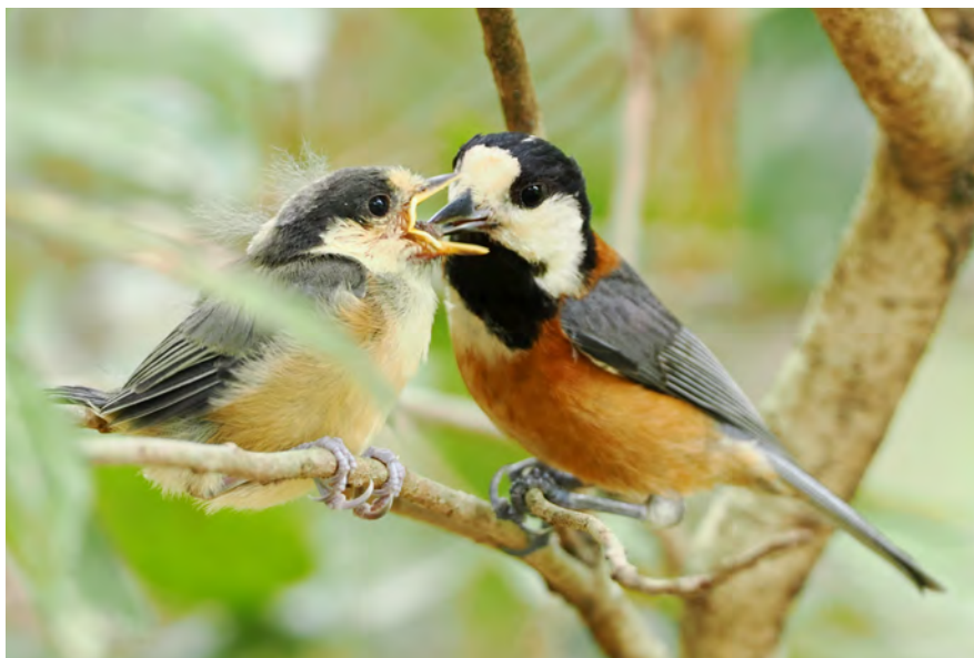
撮影地:静岡県静岡市