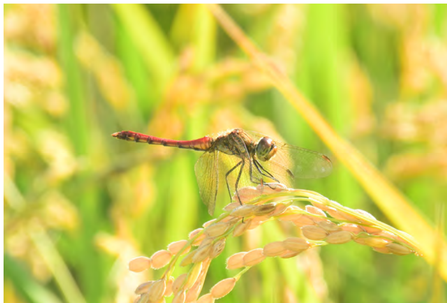
撮影地:神奈川県厚木市 / 撮影者:酒井 孝明

【 分 布 】…………… 日本国内では北海道から九州にかけて分布し、平地から山地の水田や池沼、湿地に生息します。