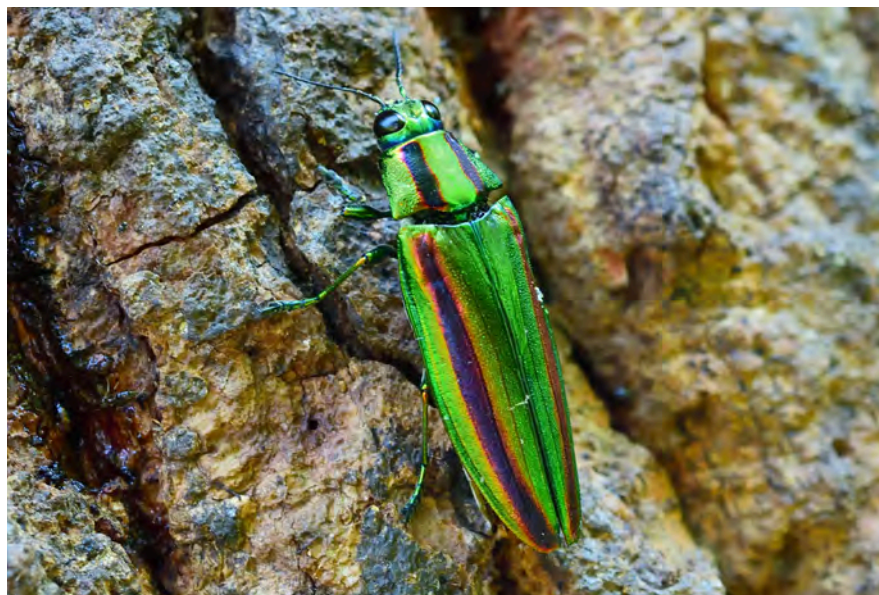
撮影地:静岡県駿東郡清水町