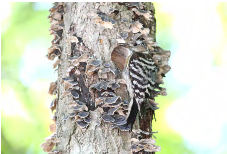
撮影地:長野県大町市

【特徴】..... 日本で一番小さなキツキの仲間で、全長15cm、スズメ位の大きさの鳥です。背中はこげ茶色で、白い点のまだら模様があります。