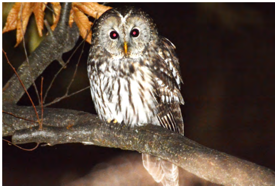
撮影地:長野県安曇野市 / 撮影者:松宮 裕秋

【分布】..... 日本では北海道から九州にかけて分布し、一年中みられる留鳥です。