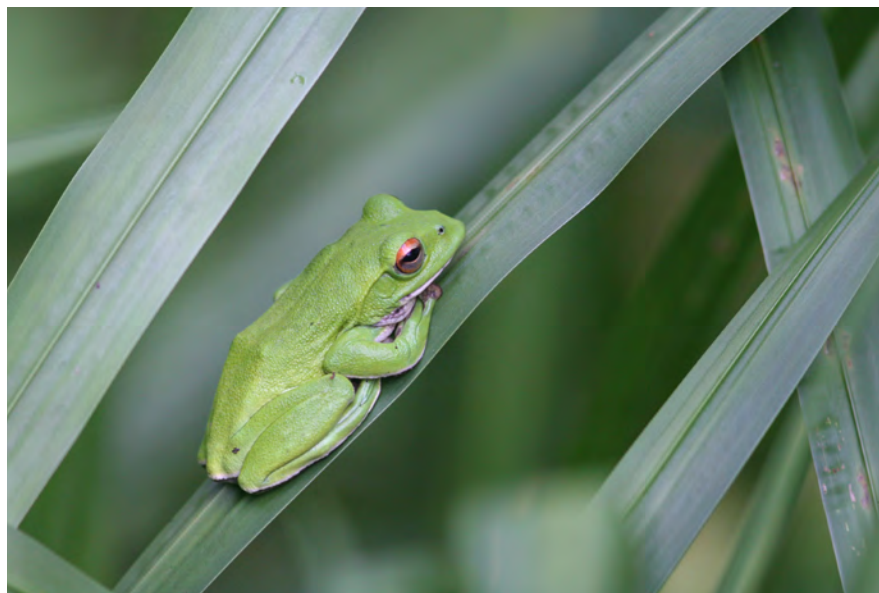
撮影地:富山県中新川郡立山町